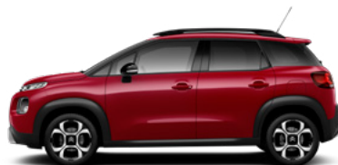
Červená PEPERONCINO (M)