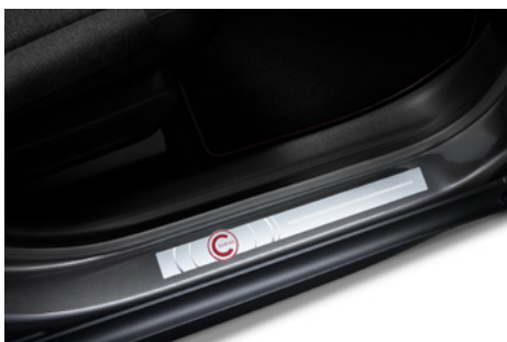
Prah dverí s motívom limitovanej edície C-SERIES