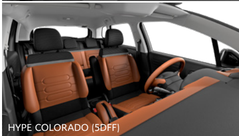
HYPE COLORADO (5DFF)