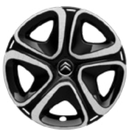
Okrasný kryt 3D 16"