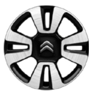
Disk MATRIX 16" Diamantovaný