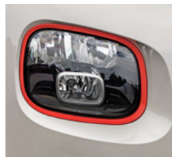
Rámčeky okolo svetlometov