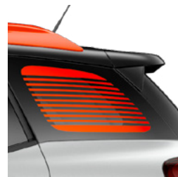
Okienka stĺpika C s pásovým motívom