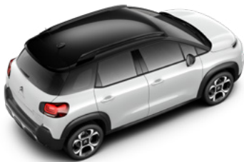
Čierna PERLA NERA