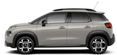
Běžová SABLE (M)