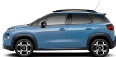
Modrá BREATHING (M)