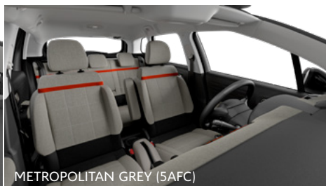
METROPOLITAN GREY (5AFC)