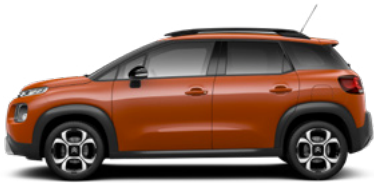
Oranžová SPICY (M)