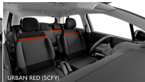
URBAN RED (5CFY)