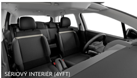
SÉRIOVÝ INTERIÉR (4YFT)