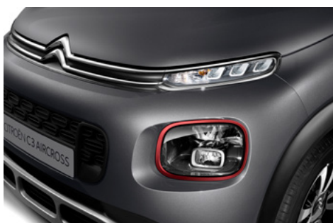
Orámovanie hmlových svetlometov v červenej farbe REGAL RED.