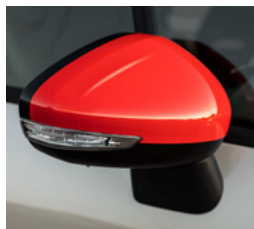
Kryty spätných zrkadiel