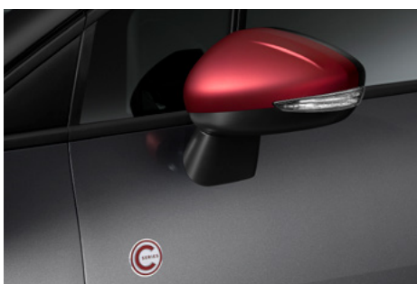
Kryty spätných zrkadiel vo farbe REGAL RED a nálepkami C-SERIES v červenej farbe