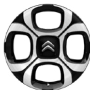
Disk 4 EVER 17" Diamantovaný