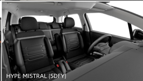
HYPE MISTRAL (5DFY)