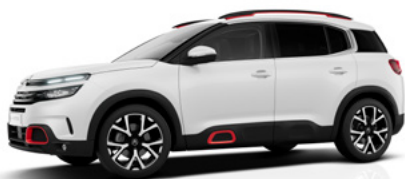
Biela Nacré (P)