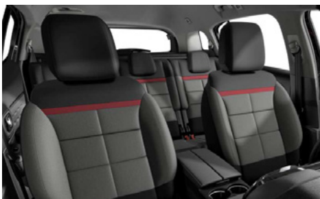
Mix látka s efektom kože (TEP) čierna + látka Stone sivá