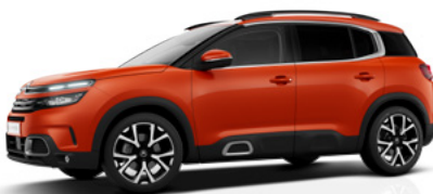
Červená Volcano (M)