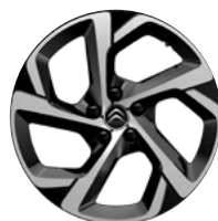
Disk z ľahkej zliatiny SWIRL diamantée, 18"