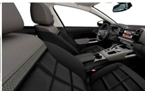
Mix koža NAPPA čierna – látka (TEP) sivá / interiér HYPE čierny