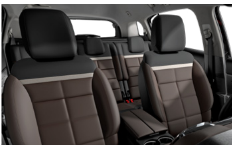
Mix koža NAPPA hnedá – látka hnedá / HYPE hnedá (1)