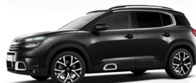
Čierna Perla Nera (M)