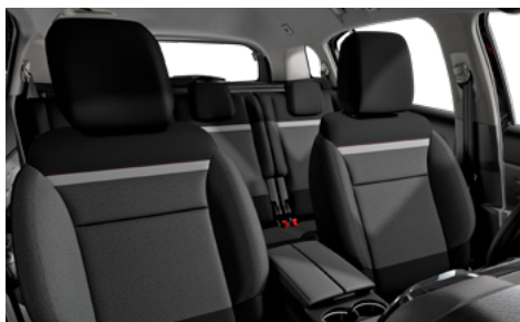
Látka SILICA sivá (v sérii pre LIVE PACK a FEEL)