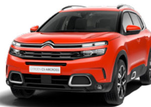
Pack Color Silver (strieboená)