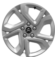
Disk z ľahkej zliatiny ELLIPSE, 17"