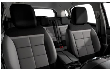
Mix koža GRAINE – grafitová látka / METROPOLITAN sivý