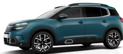
Modrá Tijuca (M)