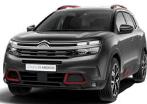
Pack Color Deep Red (červená)