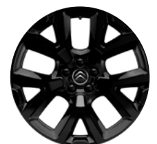
Disk z ľahkej zliatiny ART ČIERNY, 19"

• Štandardná výbava / – nedá sa objednať / (1) – Šírka vozidla, šírka vozidla so sklopenými spätnými zrkadlami; (2) – S pozdĺžnymi tyčami; (3) – Rezervné koleso je potrebné objednať ako príslušenstvo. Cena rezervného kolesa je orientačná a môže sa meniť v závislosti od objednaných dielov k samotnému rezervnému kolesu. Presný rozpis dielov dodávaných s rezervným kolesom a iných detailov Vám poskytne predajca.