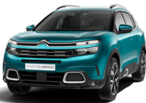
Pack Color White (biela)