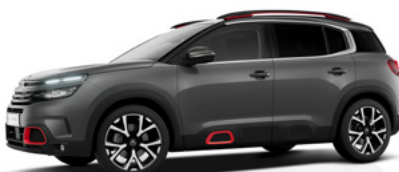
Sivá Platinum (M)