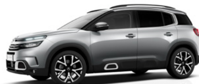
Sivá Artense (M)