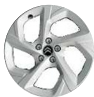
Disk z ľahkej zliatiny SWIRL, 18"