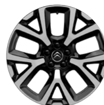
Disk z ľahkej zliatiny ART diamantée, 19"