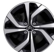
Disk VECTOR 17"