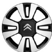
Disk MATRIX 16"