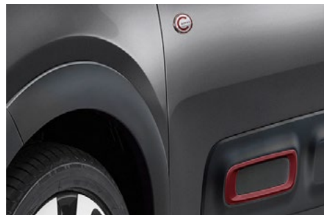
Červený prvok na Airbumppe