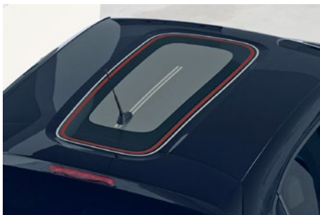
Nálepka na streche v štýle C-SERIES