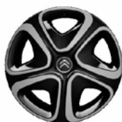
Okrasný kryt 3D 16"