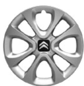
Okrasný kryt ARROW 15"