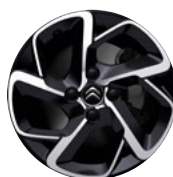
Disk BITON HELLIX 16"