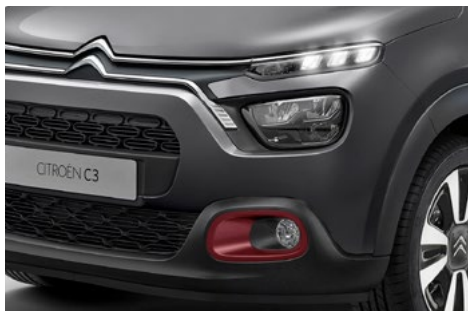
Orámovanie hmlových svetlomietov v červenej farbe REGAL RED.