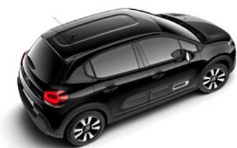
Čierna PERLA NOIR