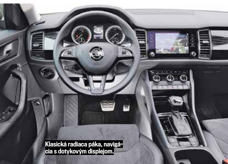
Klasická radiaca páka, navigácia s dotýkovým displejom.