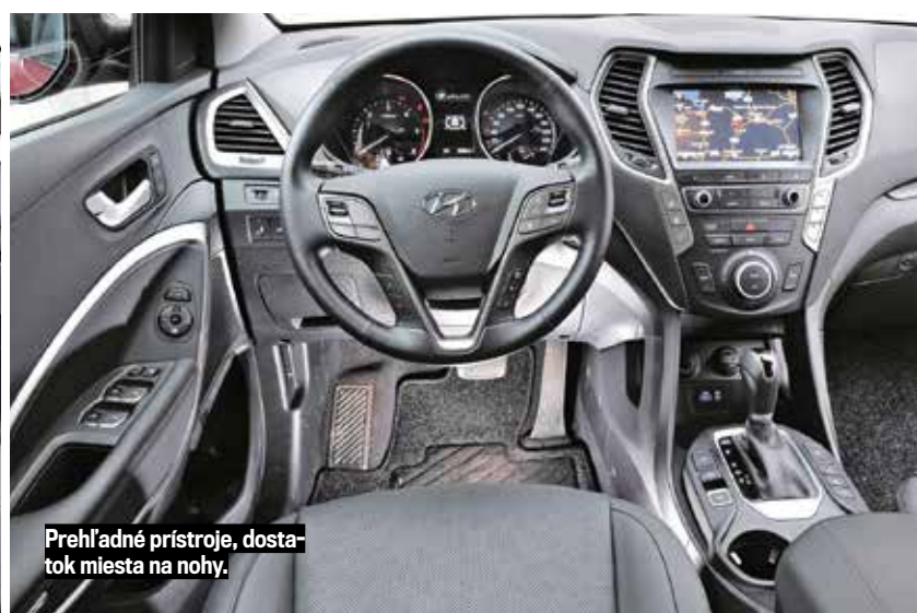
Prehľadné prístroje, dostatok miesta na nohy.

Škoda vedie: v rámci rýchlostí len na fotografií. GLC je rýchlejšie.