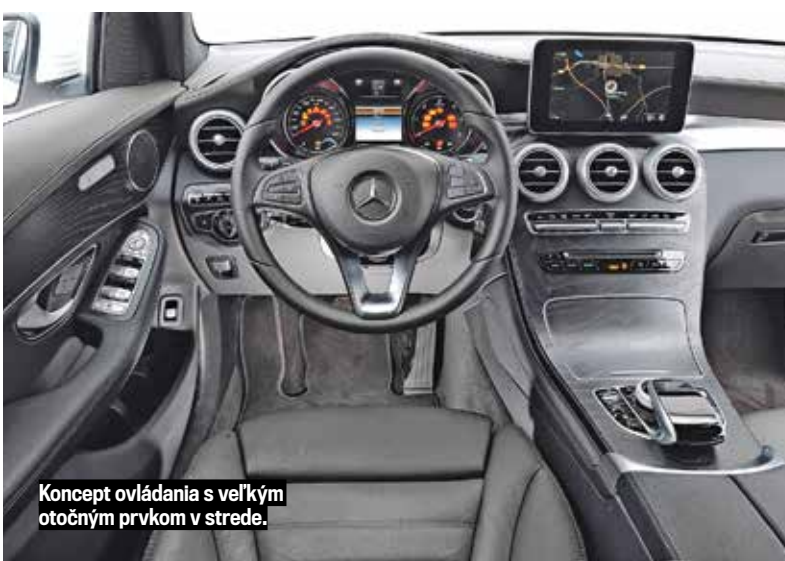
Koncept ovládania s veľkým otočným prvkom v strede.