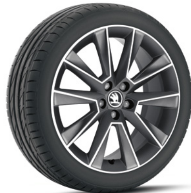
17" disky SAVIO z ľahkej zliatiny doplnková výbava