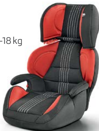
Detská autosedačka Wavo 1-2-3 ŠKODA Originálne príslušenstvo (000 019 903D) Cena: 169,74€