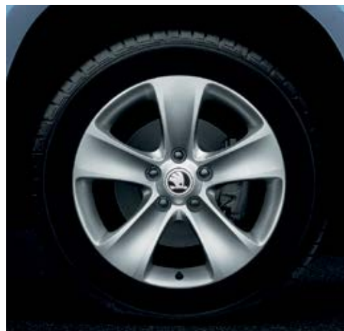
Disk z ľahkej zliatiny 7,0J x 16" Moon na pneumatiky 205/55 R16 v striebornej farbe (3T0 071 496A 7ZS) Cena: 158,98€