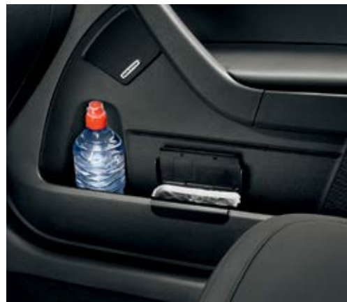
Vo vozidle značky Yeti má všetko svoje miesto vrátane nepotrebného papiera, lístkov a obalov zo sladkostí. Vyberateľný kôš na odpadky v schránke predných dverí pomôže elegantne sa ich zbaviť. Dodáva sa v dvoch farebných úpravách (5JA 061 107 9B9 - čierna; 5JA 061 107 WC4 - béžová) Cena: 11,34€