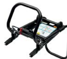
Rám ISOFIX RWF (DDF 000 003A) Cena: 161,46€