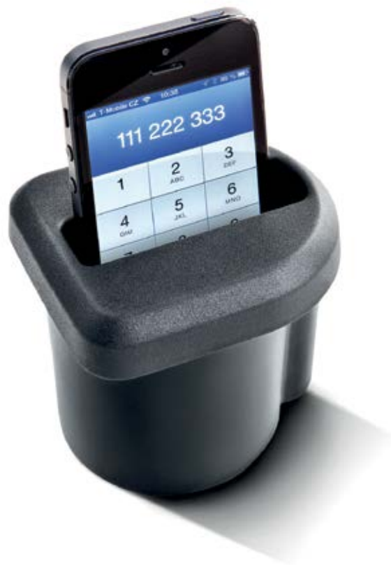
Držiak multimediálnych zariadení v stredovej konzole zaisťujú rýchlu dostupnosť a pohodlnú manipuláciu s hudobným prehrávačom, mobilným telefónom či s ďalšími multimediálnymi zariadeniami (5JA 051 435A) Cena: 6,18€