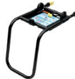
Rám ISOFIX FWF (DDF 710 002) Cena: 107,36€