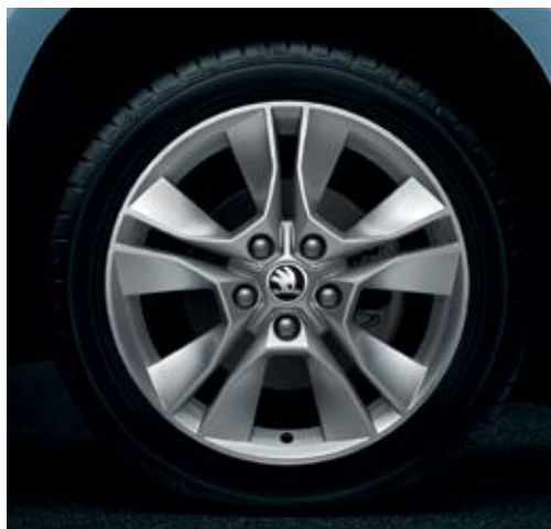
Disk z ľahkej zliatiny 7,0J x 17" Blossom na pneumatiky 225/50 R17 v striebornej farbe (5L0 071 497A 8Z8) Cena: 176,23€