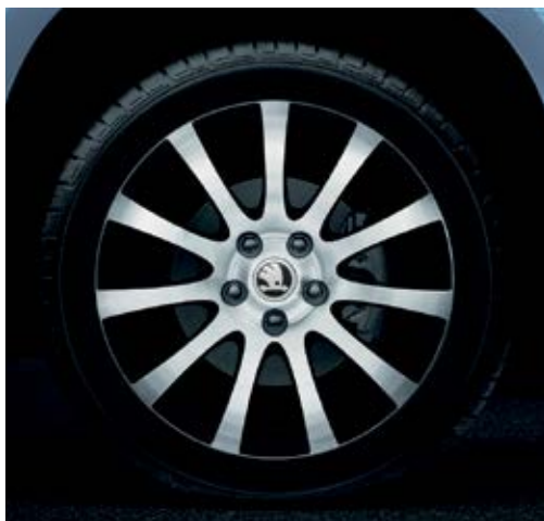
Disk z ľahkej zliatiny 7,0J x 17" Annapurna na pneumatiky 225/50 R17 v čiernej lesklej farbe (5L0 071 497D JX2) Cena: 184,86€