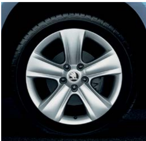
Disk z ľahkej zliatiny 7,0J x 17" Dolomite na pneumatiky 225/50 R17 v striebornej farbe (5L0 071 497G 7ZS) Cena: 165,14€