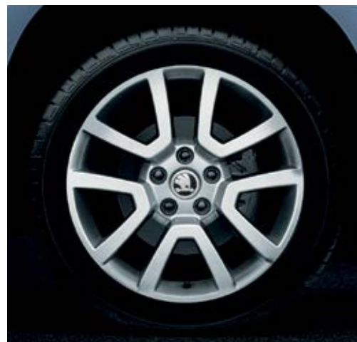
Disk z ľahkej zliatiny 7,0J x 17" Spitzberg na pneumatiky 225/50 R17 v striebornej farbe (5L0 071 497F 7ZS) Cena: 176,23€