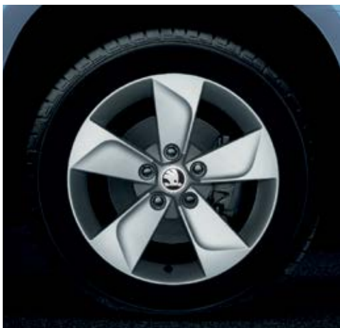
Disk z ľahkej zliatiny 7,0J x 16" Nevis na pneumatiky 205/55 R16 v striebornej farbe (5L0 071 496A 8Z8) Cena: 163,91€