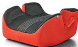
Detská autosedačka Wavo Kind ŠKODA Originálne príslušenstvo (000 019 904D) Cena: 64,86€