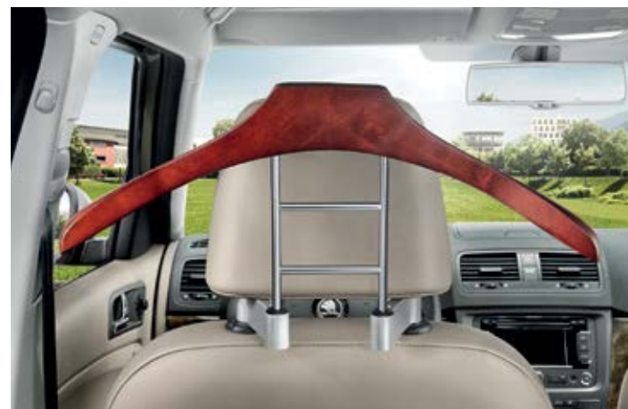
Drevený vešiak na šaty udrží váš kabát, košeľu alebo šaty v stave, že budú vyzeráť ako čerstvo vyžehlené, a to bez ohľadu na to, ako dlho pocestujete (3T0 061 127) Cena: 22,06€