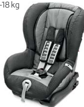
Detská autosedačka ISOFIX DUO plus Top Tether ŠKODA Originálne príslušenstvo (DDA 000 006) Cena: 470,40€