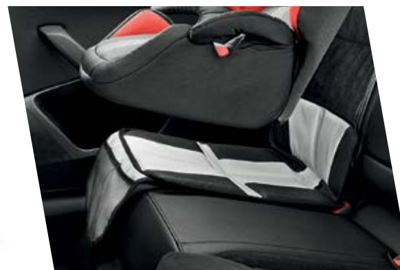
Podložka pod detskú autosedačku (000 017 819A) Cena: 16,76€