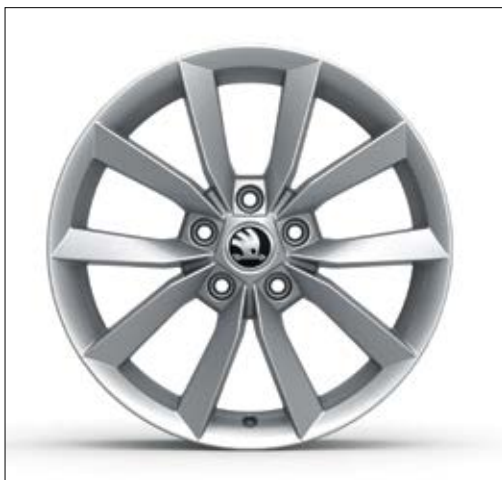
Disk z ľahkej zliatiny 7,0J x 17" Scudo na pneumatiky 225/50 R17 v striebornej farbe (5L0 071 497M 8Z8) Cena: 171,30€