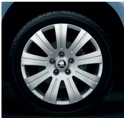
Disk z ľahkej zliatiny 6,0J x 17" Flash na pneumatiky 205/50 R17 v striebornej farbe (5E0 071 497B 7ZS) Cena: 173,77€