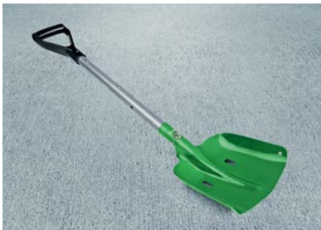
Skladacia lopata na sneh vyrobená zo zliatiny, hmotnosť 750 g, trojdielna, vrátane praktického látkového obalu (5L0 099 320) Cena: 33,77€