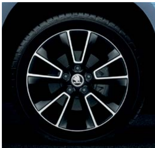
Disk z ľahkej zliatiny 7,0J x 17" Matterhorn na pneumatiky 225/50 R17 v čiernej lesklej farbe (5L0 071 497H FL8) Cena: 184,86€