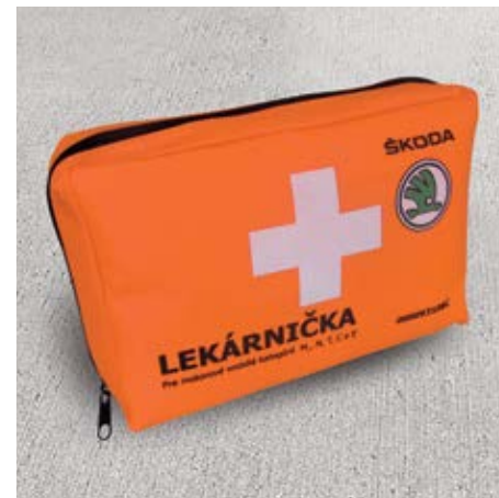
Autolekárnička (000 093 108C) Cena: 10,18€