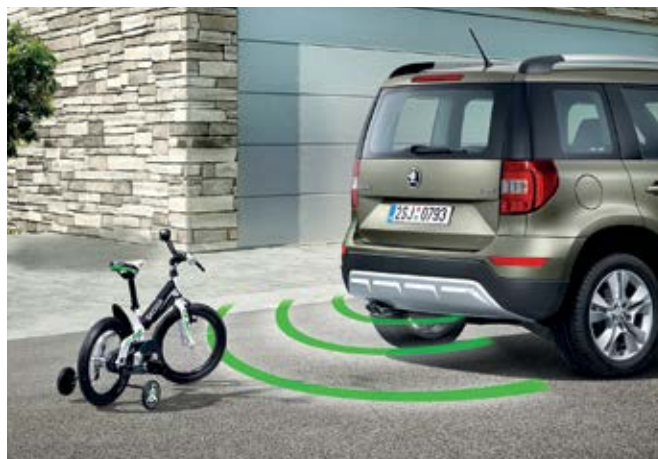
Zadné parkovacie senzory na monitorovanie vzdialenosti potenciálnych prekážok od vozidla. Ak sa vo vzdialenosti 140 cm od zadnej časti vozidla objaví prekážka, je signalizovaná krátkymi pípnutiami v intervale 1 sekundy. Tento interval sa s približovaním k prekážke plynule skracuje. Pri priblížení vozidla na 30 cm prejde pípanie do nepretržitého tónu (BEA 630 001) Cena: 230,58€