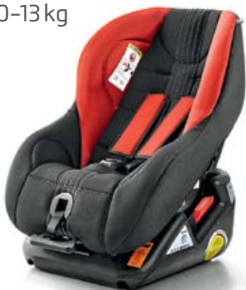
Detská autosedačka Baby-Safe Plus ŠKODA Originálne príslušenstvo (1ST 019 907) Cena: 514,74€