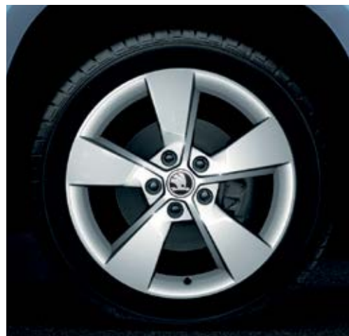
Disk z ľahkej zliatiny 7,0J x 17" Erebus na pneumatiky 225/50 R17 v striebornej farbe (5L0 071 497J 8Z8) Cena: 176,23€