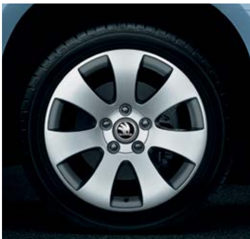
Disk z ľahkej zliatiny 7,0J x 16" Spectrum na pneumatiky 205/55 R16 v striebornej farbe (3T0 071 496 7ZS) Cena: 165,60€