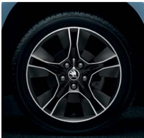
Disk z ľahkej zliatiny 7,0J x 17" Blossom na pneumatiky 225/50 R17 v čiernej lesklej farbe (5L0 071 497A JX2) Cena: 184,86€