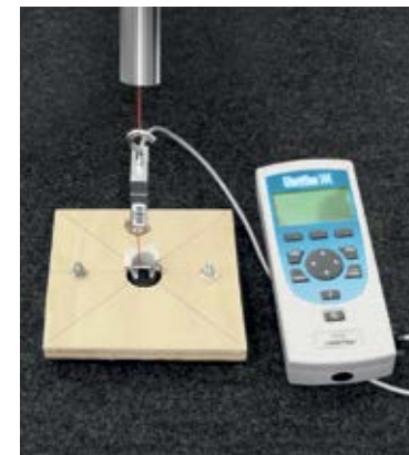
Zariadenie na vykonávanie podpätkového testu. Skúšanie pevnosti upevňovacích prvkov.