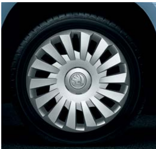
Veľkoplôšné kryty kolies kolies Nordic na kolesá 6,0J x 16"; štvordielna súprava (5E0 071 456) Cena: 54,11€