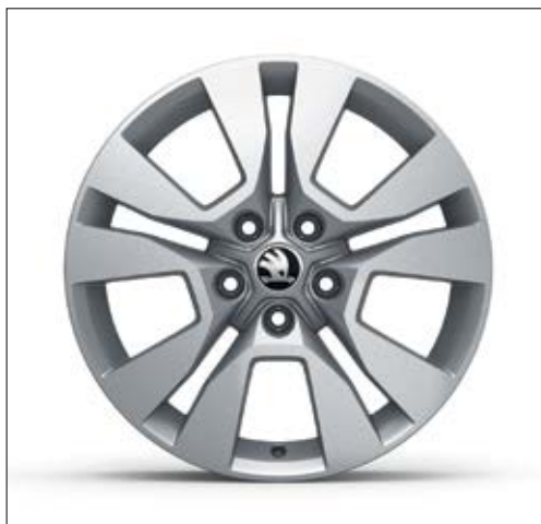
Disk z ľahkej zliatiny 7,0J x 17" Origami na pneumatiky 225/50 R17 v striebornej farbe (5L0 071 497L 8Z8) Cena: 176,23€