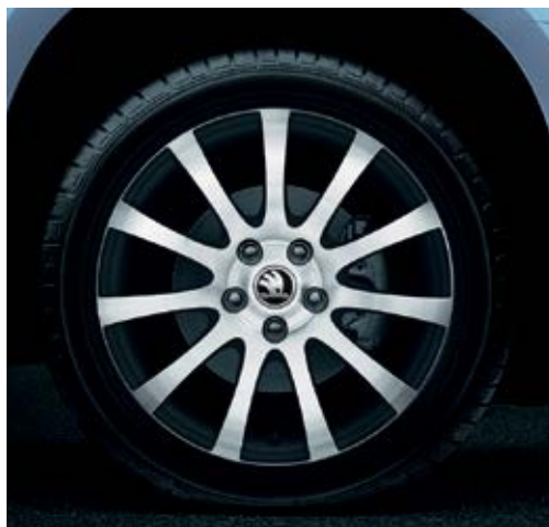
Disk z ľahkej zliatiny 7,0J x 17" Annapurna na pneumatiky 225/50 R17 vo farbe antracit sivá (5L0 071 497E HA7) Cena: 184,86€