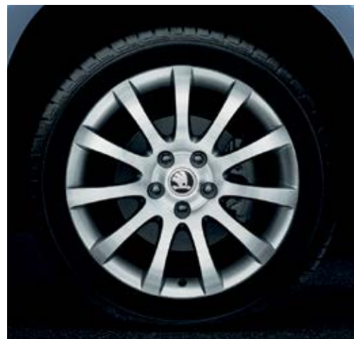
Disk z ľahkej zliatiny 7,0J x 17" Annapurna na pneumatiky 225/50 R17 v striebornej farbe (5L0 071 497C 7ZS) Cena: 176,23€