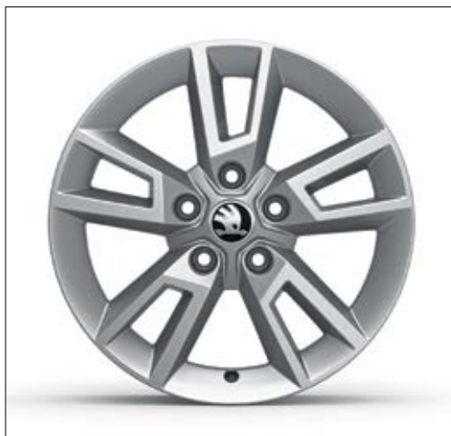
Disk z ľahkej zliatiny 7,0J x 16" Forrest na pneumatiky 205/55 R16 v striebornej farbe (5L0 071 496B 8Z8) Cena: 161,45€