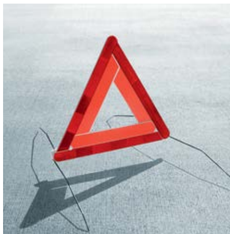
Skladný, stabilný a dobre viditeľný výstražný trojuholník so sklopnými kovovými nožičkami pre prípady núdzového státia na vozovke (GGA 700 001A) Cena: 10,96€