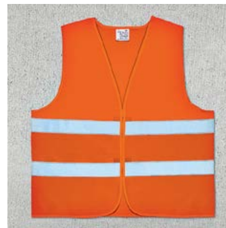
Reflexná výstražná vesta (XXA 009 001) Cena: 3,52€