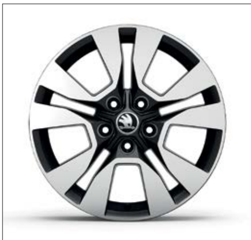
Disk z ľahkej zliatiny 7,0J x 17" Origami na pneumatiky 225/50 R17 v čiernej lesklej farbe (5L0 071 497K FL8) Cena: 184,86€