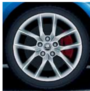
18" disky Gemini z ľahkej zliatiny