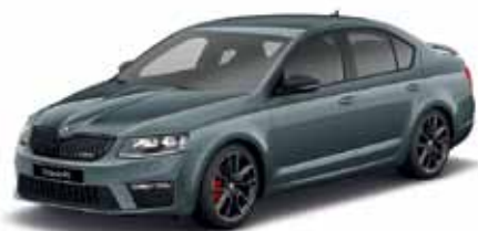
Sivá Quartz metalíza