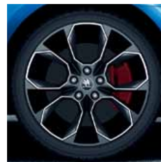
19" disky Xtreme z ľahkej zliatiny v antracitovom vyhotovení

Všetky RS modely sú dodávané štandardne s červenými brzdovými strmeňmi.