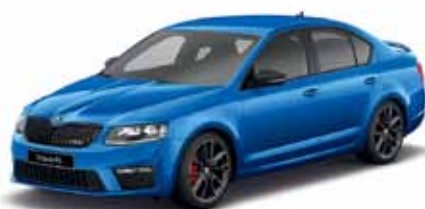
Modrá Race metalíza