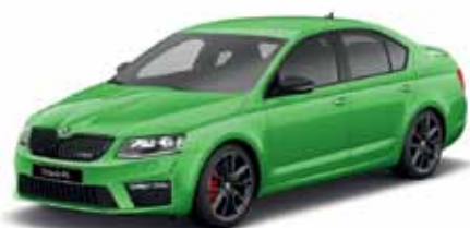
Zelená Rally metalíza