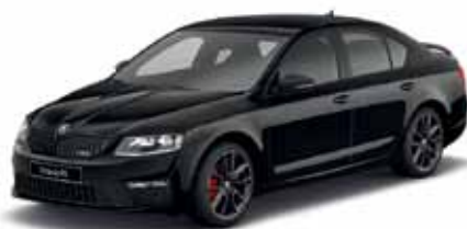
Čierna Magic s perleťovým efektom