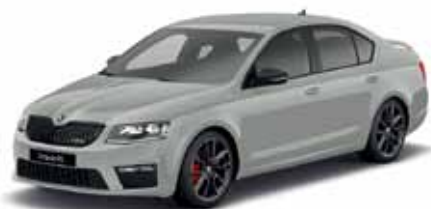
Sivá Steel uni