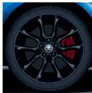
18" disky Gemini z ľahkej zliatiny v čiernom vyhotovení