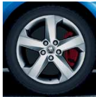
17" disky Dorado z ľahkej zliatiny

Ak preferujete celokožené čalúnenie, môžete si vybrať interiér v kombinácii koža/umelá koža, ktorý je dostupný s červeným alebo sivým prešívaním.