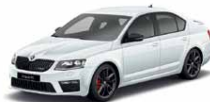
Biela Moon metalíza