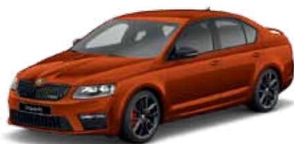
Červená Rio metalíza