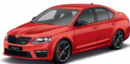
Červená Corrida uni