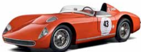
ŠKODA 1100 OHC, Spider, pribl. 1957.

Je to jednoducho Simply Clever. Jednoducho ŠKODA.