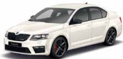
Biela Candy uni