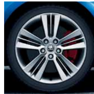
18" disky Pictoris z ľahkej zliatiny