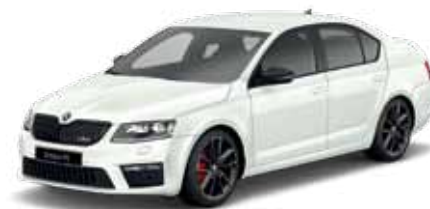
Biela Laser uni