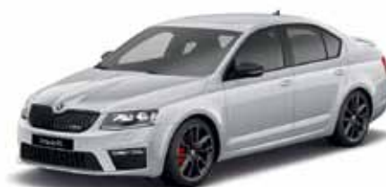
Strieborná Brilliant metalíza