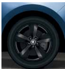
15" disky Matone z ľahkej zliatiny, čierne vyhotovenie