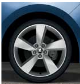
17" disky Camelot z ľahkej zliatiny