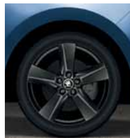
16" disky Rock z ľahkej zliatiny, čierne vyhotovenie