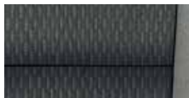
Interiér Ambition Sivá/čierna textília