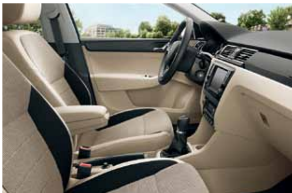
Interiér béžová Style, dekor BLACK PIANO

Vyhotovenie interiéru Style je dodávané s pochrómovanými ozdobnými prvkami, ako sú napríklad kľučky dverí, rámovanie vetracích otvorov, číselníkov prístrojového panela a detailmi volantu. Vybrať si tiež môžete z viacerých druhov čalúnení a farebných kombinácií dekoru. Štandardná výbava obsahuje rádio SWING, automatickú klimatizáciu CLIMATRONIC, kožený volant s malým koženým paketom a i.