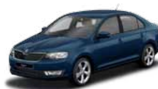
Modrá Pacific uni