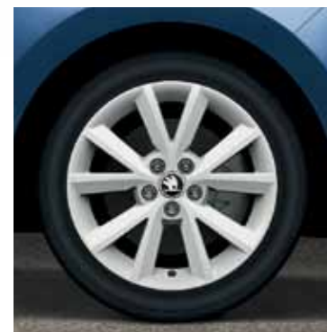
16" disky Beam z ľahkej zliatiny; biele vyhotovenie