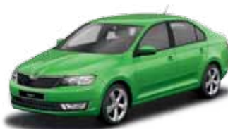
Zelená Rallye metalíza