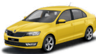
Žltá Sprint special