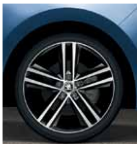
17" disky Ray z ľahkej zliatiny