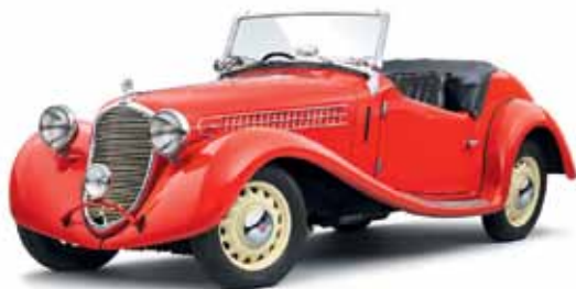
Škoda Rapid, Roadster, pribl. 1938.