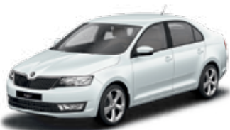
Biela Moon metalíza