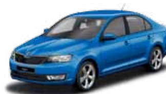
Modrá Race metalíza