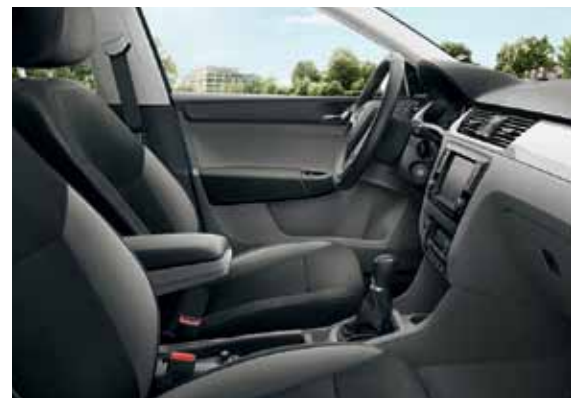
Interiér sivá Ambition, dekor WHITE PIANO