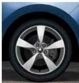
16" disky Dione z ľahkej zliatiny