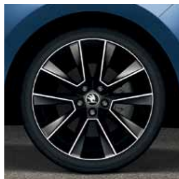
17" disky Savio z ľahkej zliatiny; vyhotovenie brúsený kov/lesklá čierna