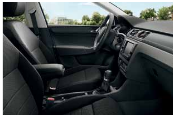
Interiér čierna Style, dekor DARK BRUSHED