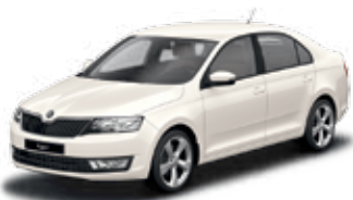
Biela Candy uni