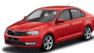
Červená Corrida uni