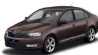
Hnedá Topaz metalíza