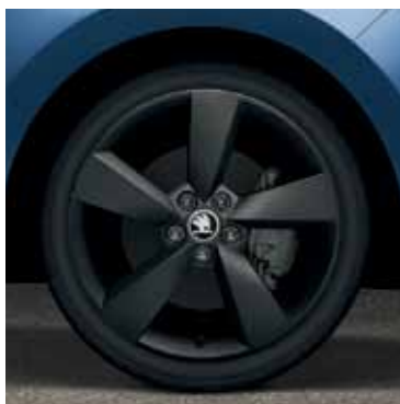
17" disky Prestige z ľahkej zliatiny; vyhotovenie matná čierna

Vykročte z radu a odlište sa! Paket Red&Grey obsahuje dizajnový set fólií, spojler 5. dverí a kryty spätných zrkadiel v čiernej farbe, zatmavené zadné svetlomety a predné hmlové svetlomety, a 17" disky Savio z ľahkej zliatiny v červenom vyhotovení.