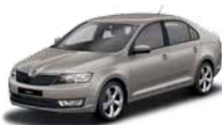
Béžová Cappuccino metalíza