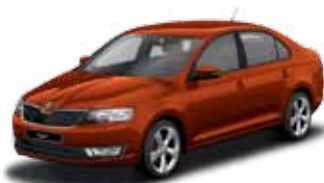
Červená Rio metalíza