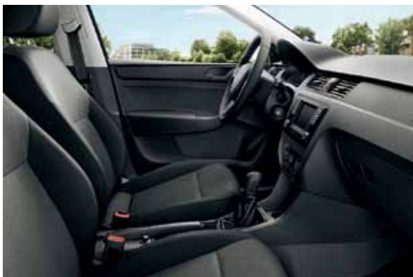
Interiér čierna Active