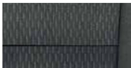
Interiér Ambition Čierna textília