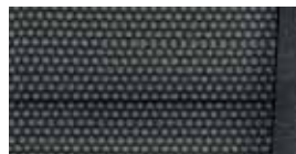
Interiér Style Čierna textília