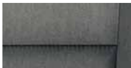
Interiér Active Sivá/čierna textília