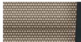
Interiér Style Béžová textília