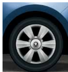
15" ocelové disky s krytmi Dentro