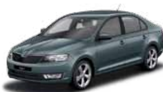
Sivá Quartz metalíza