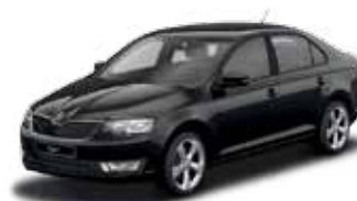
Čierna Magic s perleťovým efektom