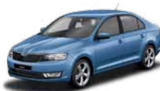
Modrá Denim metalíza