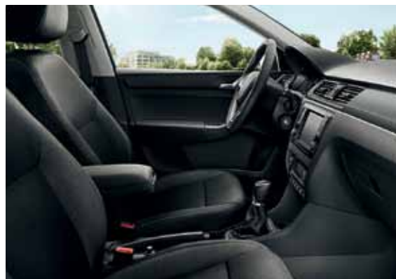
Interiér čierna Ambition, dekor DARK BRUSHED