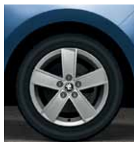
15" disky Propeller z ľahkej zliatiny