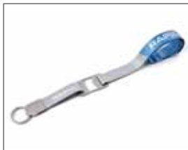
Šnúrka na krk