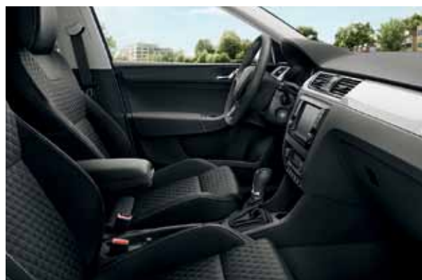
Interiér Dynamic, dekor WHITE PIANO

Príplatkový balík Dynamic je dostupný pre výbavové stupne Ambition a Style. Obsahuje exkluzívne športové sedadlá, športový volant s malým koženým paketom a kryty pedálov z ušľachtilej ocele pre zvýraznenie jedinečného charakteru vášho vozidla.