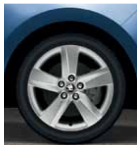
16" disky Rock z ľahkej zliatiny, strieborné vyhotovenie