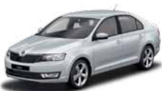
Strieborná Brilliant metalíza