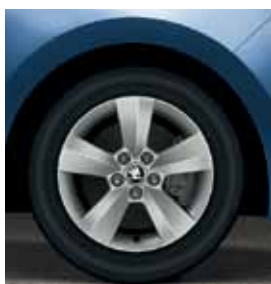
15" disky Matone z ľahkej zliatiny, strieborné vyhotovenie