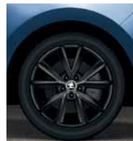
16" disky Antia z ľahkej zliatiny, vyhotovenie čierna metaliza