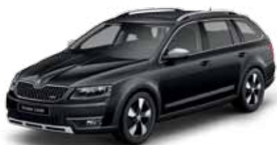
Čierna Magic s perleťovým efektom