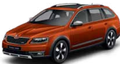
Červená Rio metalíza