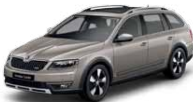
Běžová Cappuccino metalíza