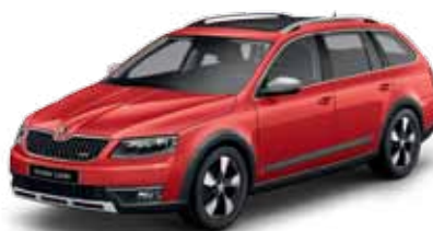
Červená Corrida uni