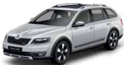
Strieborná Brilliant metalíza