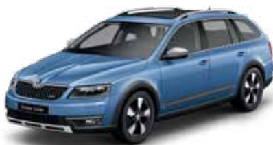
Modrá Denim metalíza