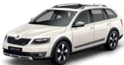
Biela Candy uni