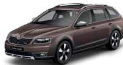
Hnedá Topaz metalíza