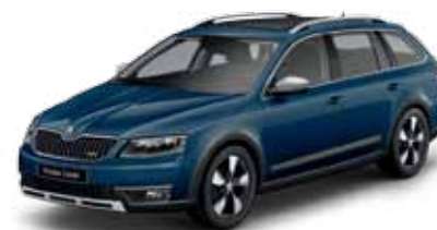
Modrá Pacific uni