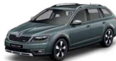
Sivá Metal metalíza