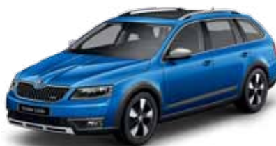
Modrá Race metalíza